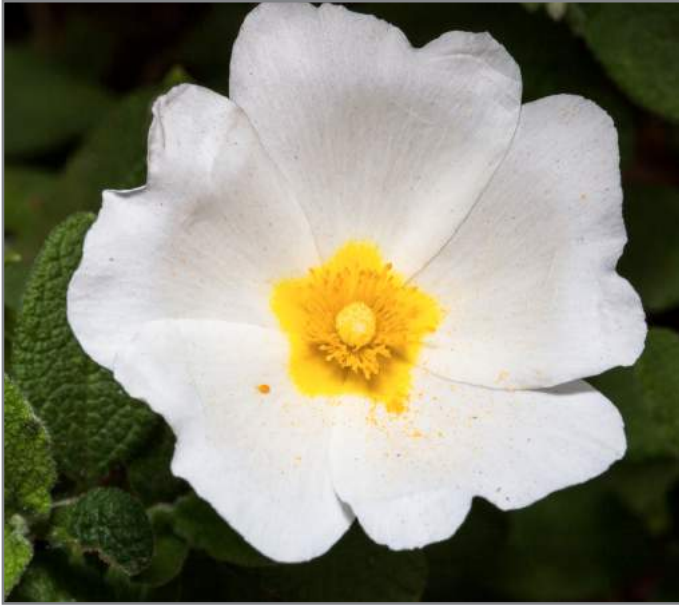
Cisto femmina Sage-leaved cistus ( Cistus salvifolius )