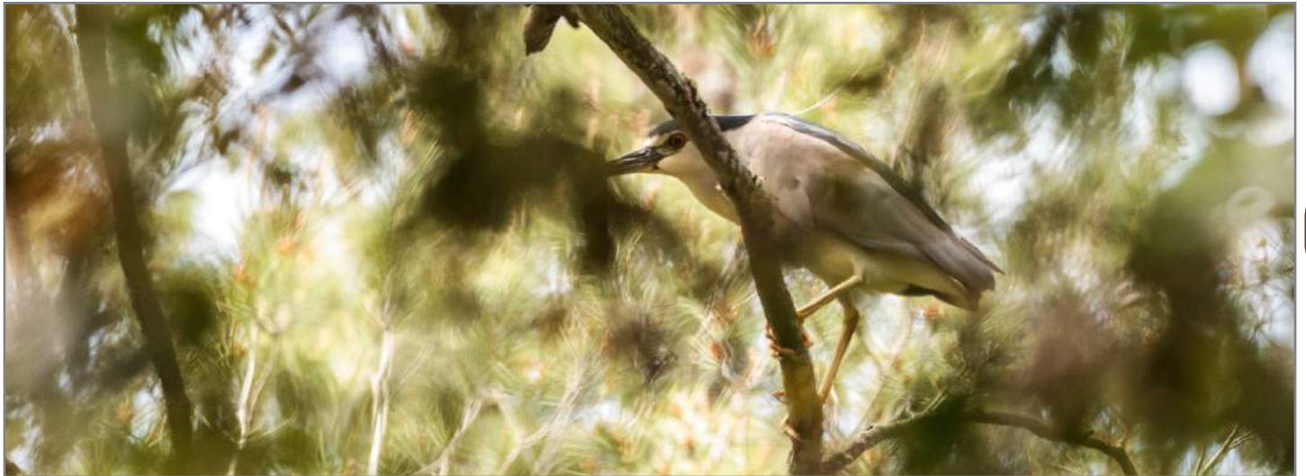
Nitticora Black-Crowned Night Heron ( Nycticorax nycticorax )