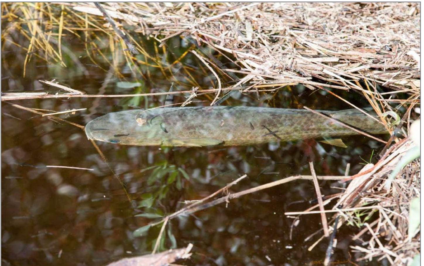
Cefalo Mullet ( Mugil cephalus )