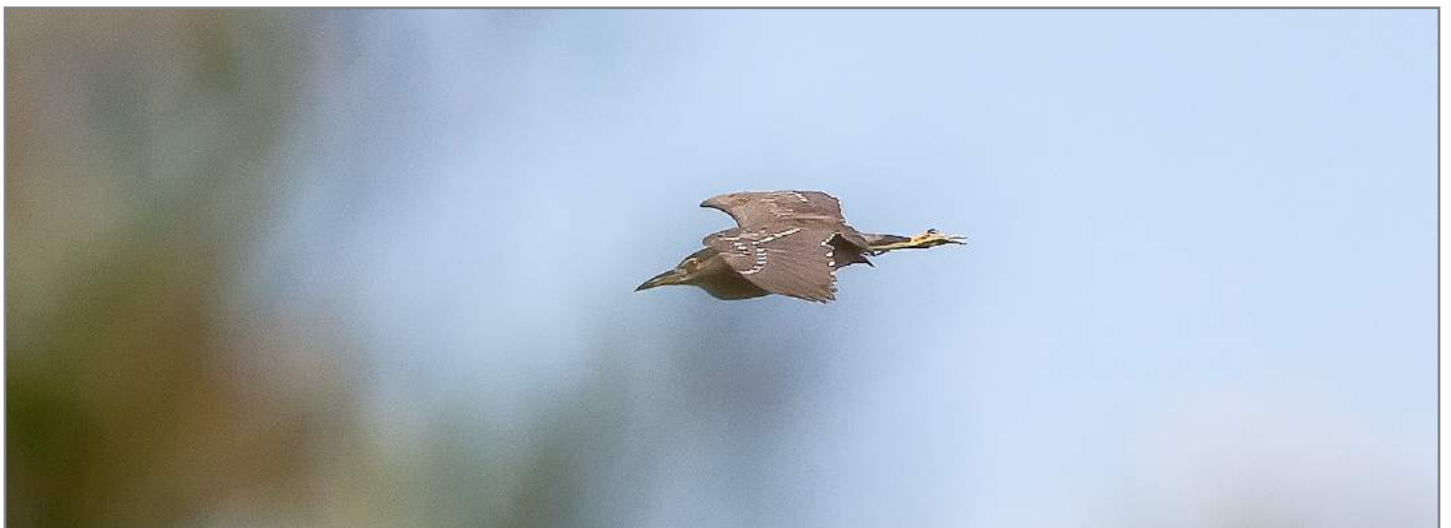
Esemplare giovane di Nitticora juvenile Black-Crowned Night Heron ( Nycticorax nycticorax )