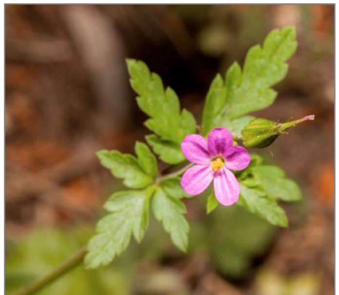
Geranio ( Geranium sp. )