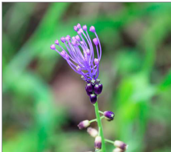
Lampascione Tassel grape-hyacinth ( Muscari comosum )