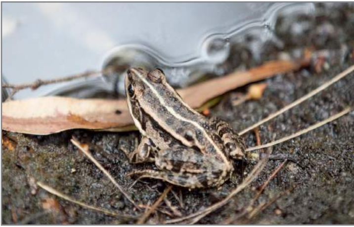
Rane Frogs ( Pelophylax esculentus complex)