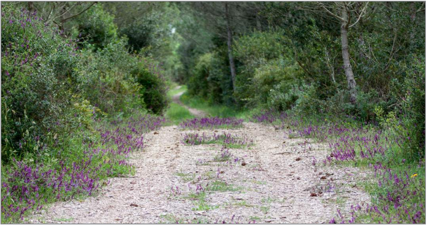
Veccia Vetch ( Vicia villosa subsp. microphylla )