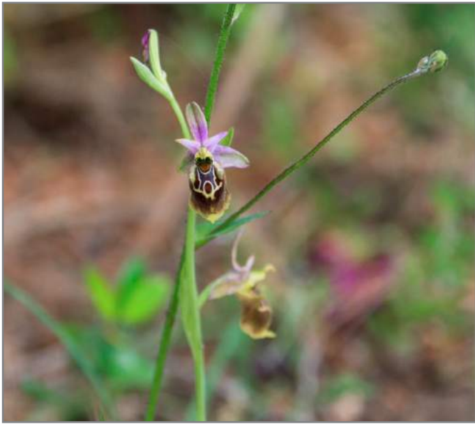
Ofride ( Ophrys sp.)