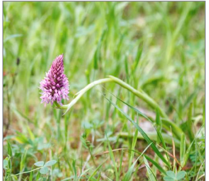
Orchidea piramidale Pyramidal orchid ( Anacamptis pyramidalis )