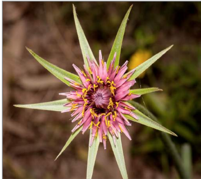
Barba di becco violetta Vegetable Oyster ( Tragopogon porrifolius )