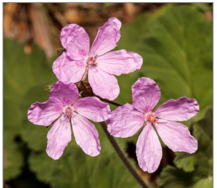
Becco di grù laciniatospecie inserita nella Lista Rossa Cut Leaved Stork's Bill ( Erodium nervulosum ) Red List