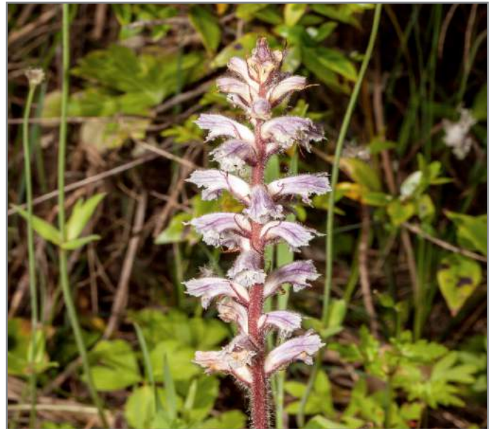
Succiamele delle fave Carnation Scented Broomrape ( Orobanche crenata )