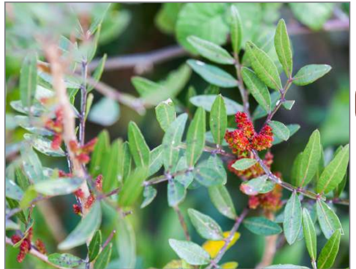
Lentisco Mastic tree ( Pistacia lentiscus )