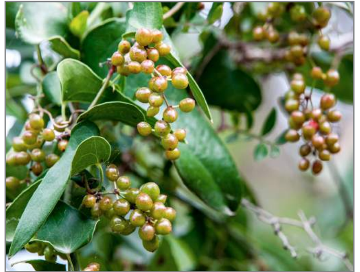
Stracciabrache Sarsaparille ( Smilax aspera )