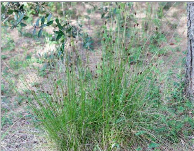
Giunco-nero comune Black bog-rush ( Schoenus nigricans )