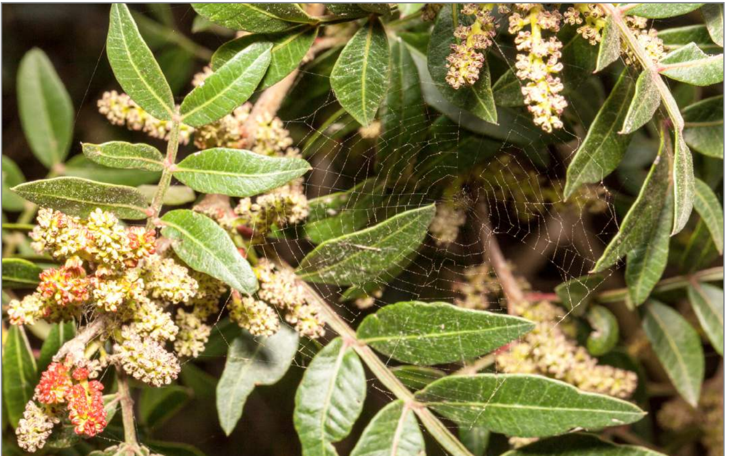
Lentisco Lentisk ( Pistacia lentiscus )