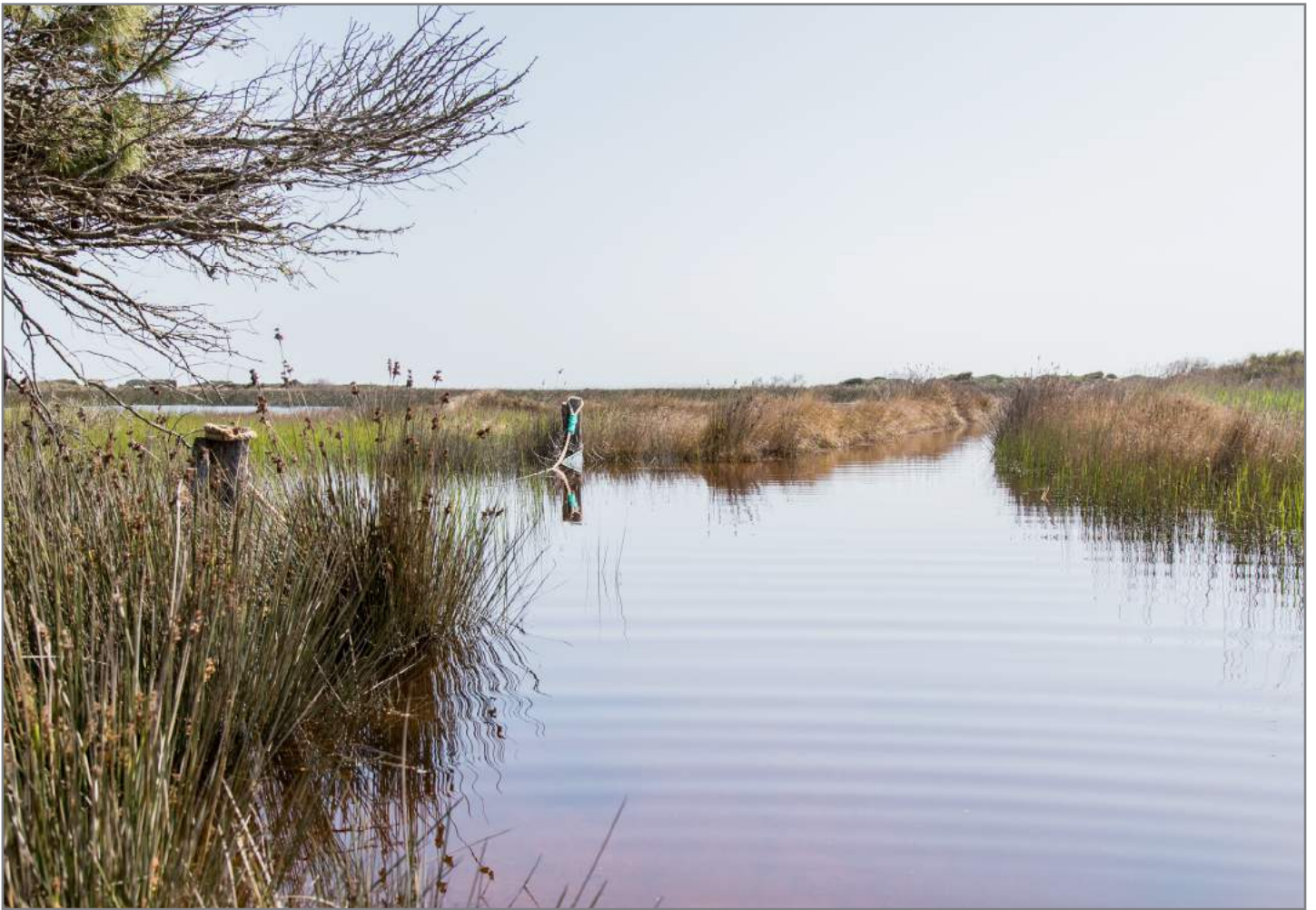
Una veduta dello stagno View of the pond