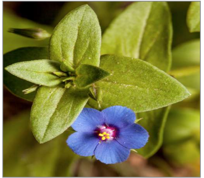
Centonchio dei campi Scarlet Pimpernel ( Anagallis arvensis )