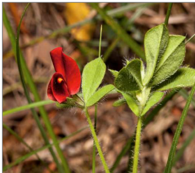
Ginestrino purpureo Asparagus pea ( Tetragonolobus Purpureus )