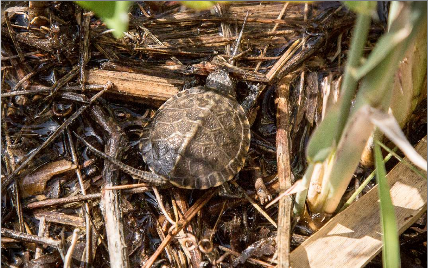
Testuggine palustre europea European pond turtle ( Emys orbicularis )