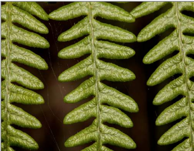
Felce Fern ( Pteridium aquilinum )