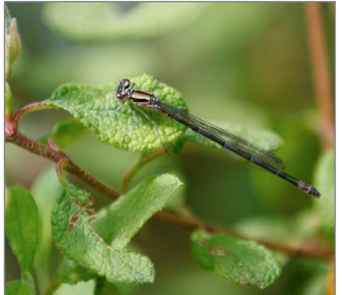
Varie specie di libellule Various species of dragonfly