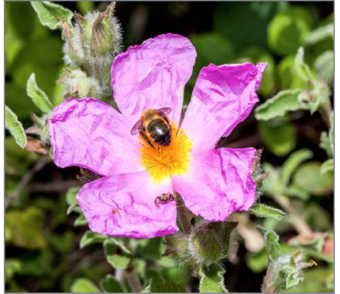
Cisto rosso Rock Rose ( Cistus creticus L. subsp. Erioccephalus )