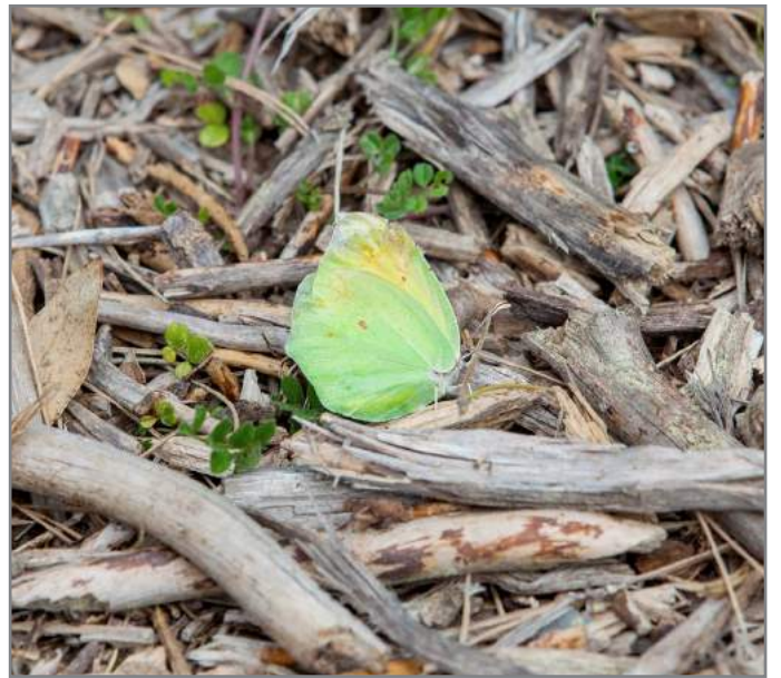
Farfalla Cleopatra Cleopatra butterfly ( Gonepteryx cleopatra )