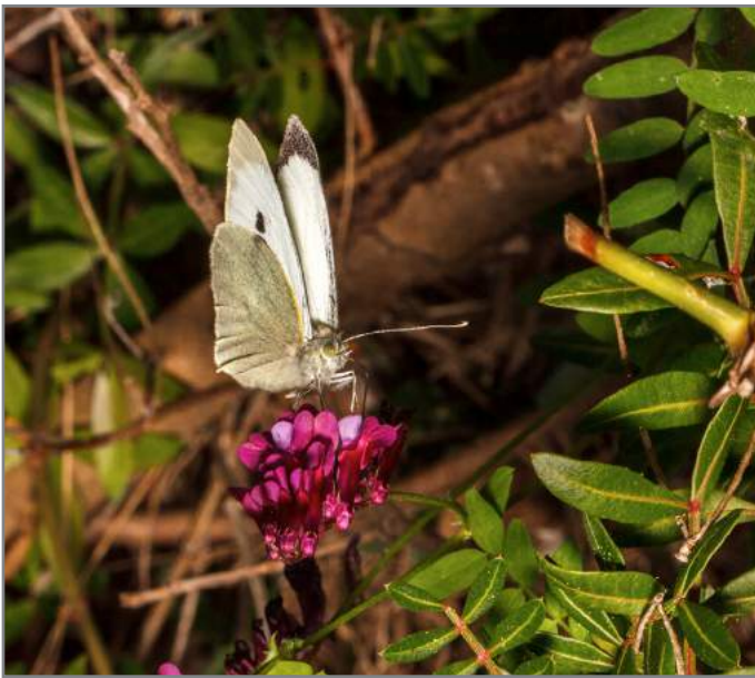
Cavolaia Large White ( Pieris brassicae )