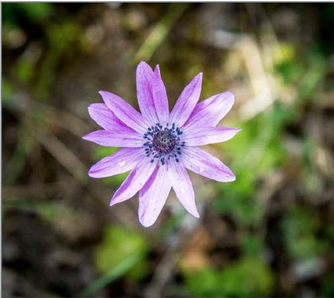
Anemone fior di stella Broad Leaved Anemone ( Anemone hortensis )