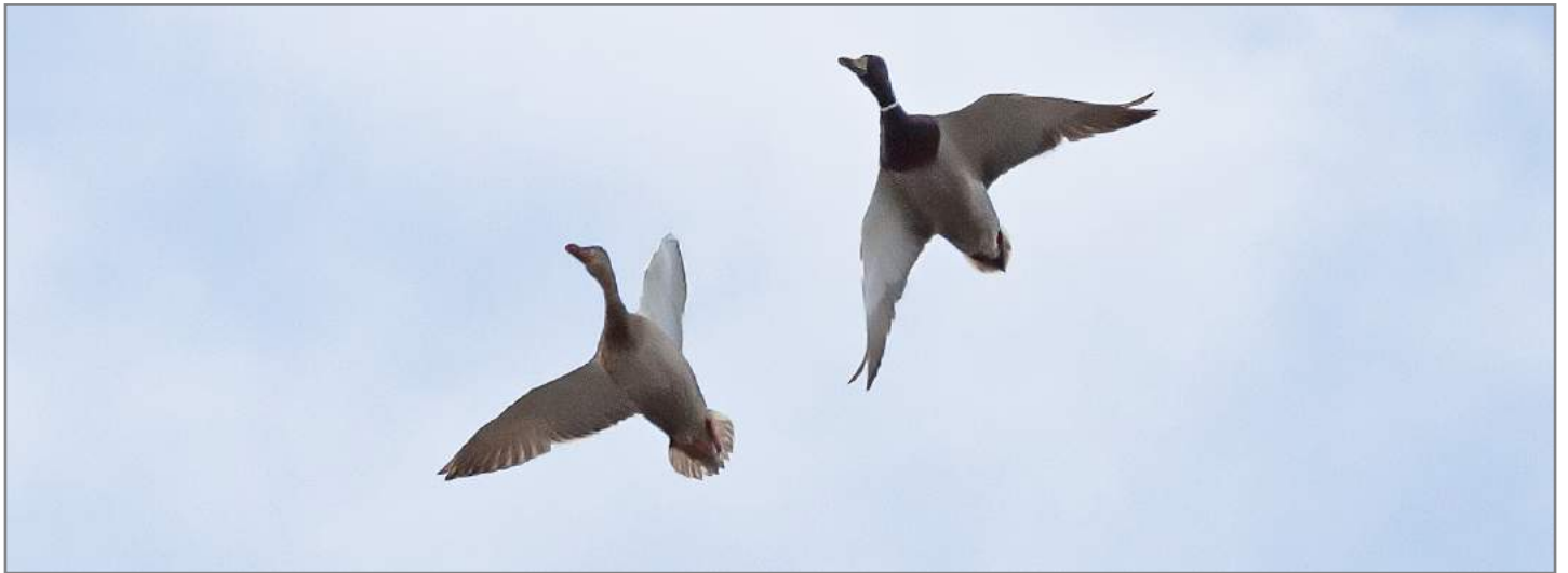
Germano reale ♀ e ♂ Mallard ( Anas platyrhynchos )