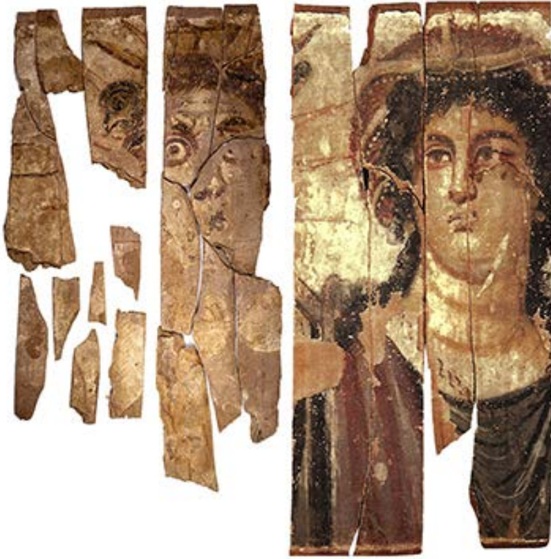
Fig. 5. Ricostruzione virtuale del pannello Dime ST21/1402/6599 e JE 38250 (Per quest'ultimo @Vincent Rondot, Derniers visages des dieux d'Égypte , p. 111)

sono di particolare interesse poiché appartengono a tavole dipinte rinvenute in passato e conservate in varie collezioni. Grazie alla pubblicazione di V. Rondot, Dernier visages des dieux d'Égypte (Paris 2013), è stato possibile abbinare ad alcune tavole i nostri pezzi che vanno così a “completare” raffigurazioni la cui provenienza era finora ignota. Sono così state ricontestualizzate almeno tre tavole dipinte di cui non era noto il luogo preciso di rinvenimento, come è del resto accaduto per molti oggetti e papiri venduti alla fine del XIX secolo sul mercato antiquario. Le tavole dipinte sono conservate nel Museo Egizio del Cairo e ad Oxford (JE 38250; 31571b; Oxford 24 +Cairo JE 31571a) (Figg. 5-