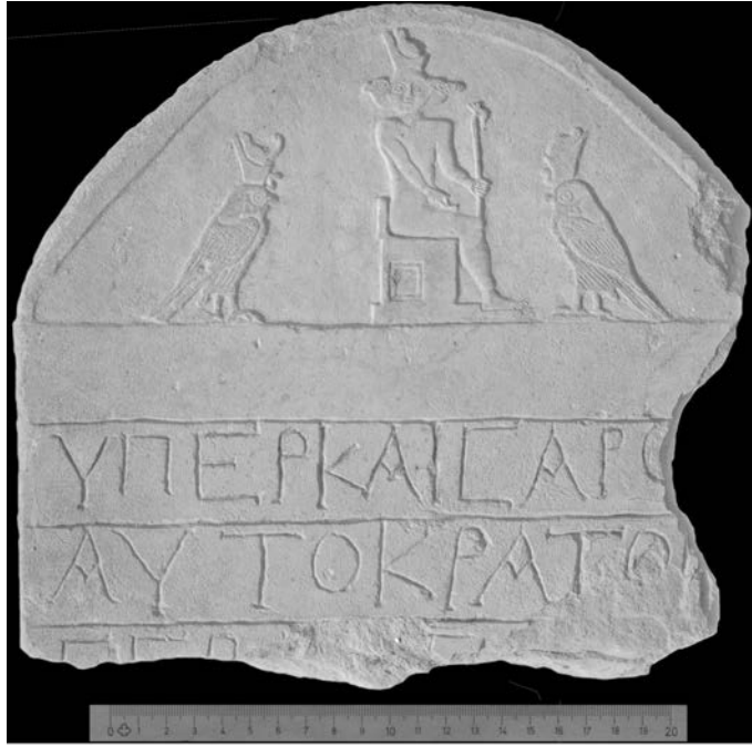
Fig. 10. Stele Dime ST10/713/3533

La mancanza del testo non consente una interpretazione precisa della raffigurazione, ma il significato del linguaggio iconografico è chiaro e rimanda ad una divinità solare e alla regalità divina: forse un esplicito riferimento alla propaganda imperiale romana 37 ? Anche in questo caso il contesto di rinvenimento della stele, il tempio del dio Soknopaios, ovvero di “Sobek signore dell’isola”, suggerisce l’identificazione del dio a tre teste con la divinità principale del tempio, altrimenti raffigurato come cocodrillo con testa di falco e corona pschent 38 .