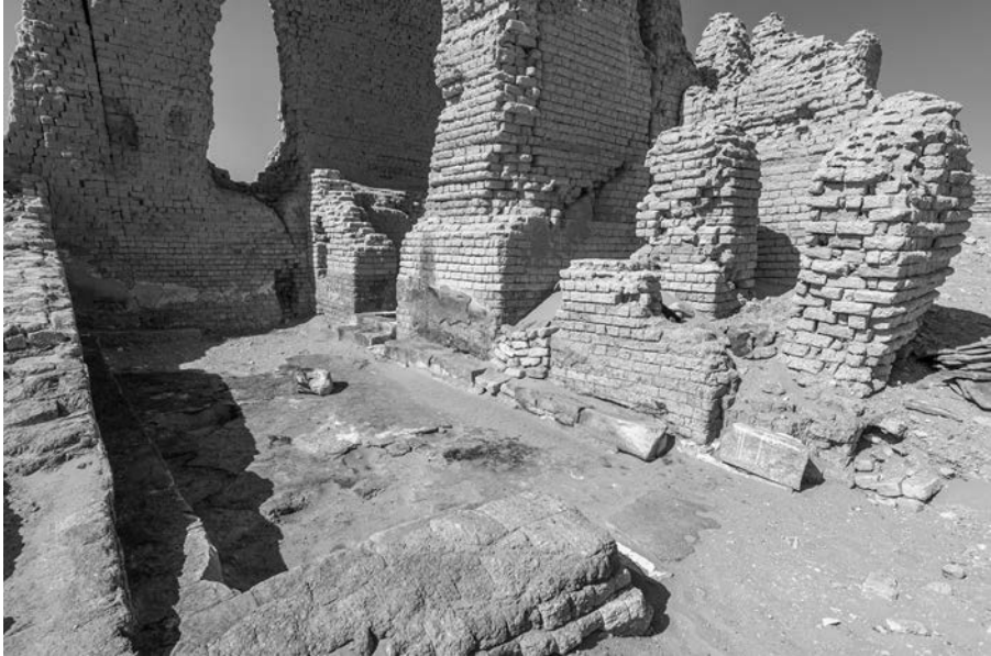
Fig. 12. Sala ST 6B antistante a ST 6A

L'ingresso a ST 6A era costituito da un portale in blocchi di calcare giallo di cui resta solo la base con la soglia, situato al centro del lato corto sud. Ad esso si giungeva attraverso una stanza che fungeva da vestibolo, orientata est-ovest e dotata lungo tutto il perimetro interno di panche in blocchi di pietra riutilizzati, che fungevano da sedili (Fig. 12). Sembra dunque trattarsi di una sala per riunioni. Per ora la mancanza di epigrafi non consente una precisa attribuzione cronologica e funzionale: potrebbe trattarsi per entrambe di sale ad uso dei sacerdoti o delle confraternite.