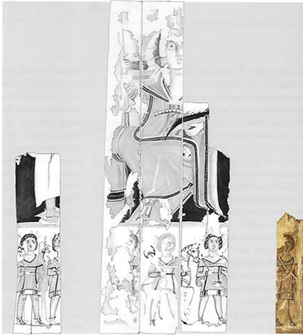
Fig. 7. Ricostruzione virtuale del pannello JE 31571a Oxford 1922.238 (@Vincent Rondot, Derniers visages des dieux d'Égypte , p. 301) con aggiunta di Dime 6886

I pannelli JE 31571 a e b del Museo del Cairo vennero acquistati nel 1889 e la loro provenienza è genericamente indicata come Fayyum 26 . Si tratta dunque verosimilmente di rinvenimenti da parte di scavatori clandestini giunti poi sul mercato antiquario e venduti a diversi acquirenti nonostante la loro frammentarietà. Anche la tavola JE 38250 proviene dal Fayyum ma fu registrata nel 1905-6. In questo caso è stato possibile ricostituire in buona parte il lato destro del pannello e completare quindi la scena in cui sono raffigurati i busti di due divinità (Fig. 5). Entrambi sono rappresentati in visione frontale, con i volti leggermente rivolti verso il centro del pannello. Le due figure sono coronate con corone di tradizione faraonica, sebbene molto stilizzate e di ridotte dimensioni: una corona composta per la figura maschile, estremamente appiattita e quindi deformata, in cui si riconoscono due corna laterali, tra le quali è lo pschent bianco e rosso; la corona isiaca con disco solare tra corna bovine, sormontato