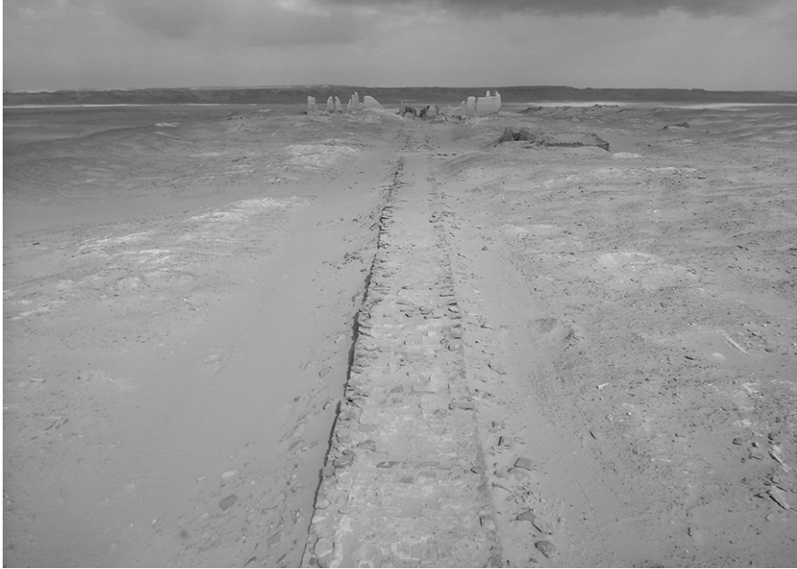
Fig. 1. Vista del dromos e del tempio verso nord

La presenza di edifici pre-ellenistici in mattoni crudi costruiti sulla collina che caratterizza l'orografia del sito, pesantemente demoliti e dunque di scarsa leggibilità, è stata rilevata sul fondo del saggio effettuato nel cortile C1 situato tra ST 18 e ST 20. Al momento non è stato possibile attribuire una datazione a tali lacerti murari, che vanno verosimilmente connessi con la presenza nel territorio circostante di manufatti databili alla XIX e alla XXVI dinastia 16 . La demolizione e il riutilizzo dei materiali architettonici a Soknopaiou Nesos è una caratteristica costante di tutti i periodi: un chiosco tolemaico in blocchi di calcare giallo, con colonne e muri di intercolumnio, venne demolito verosimilmente al momento della costruzione del muro del temenos e i suoi blocchi reimpiegati nella costruzione del portale sud. Quest'ultimo, a sua volta, è stato demolito fino ad un'altezza di ca. 2 metri dopo l'abbandono dell'insediamento e i cui resti sono stati posti in luce nel 2022. Elementi architettonici attestanti