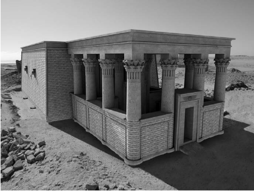
Fig. 13. Ricostruzione virtuale del contra-temple (realizzazione M. Limoncelli)

arco ( segmental pediment ) con un disco al centro a rilievo e con dentelli alla base. Si tratta dunque di una cappella isiaca, simile a quella rinvenuta a Medinet Madi, dedicata a Isis-Thermouthis, e alle raffigurazioni sulla monetazione di epoca romana 51 .