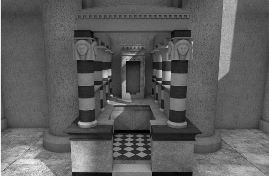
Fig. 14. Ricostruzione virtuale della cappella pseudo periptera nel contra-temple (realizzazione M. Limoncelli)

nica e del disegno suggerisce che questi pavimenti siano stati realizzati contemporaneamente, probabilmente durante il II secolo d.C.