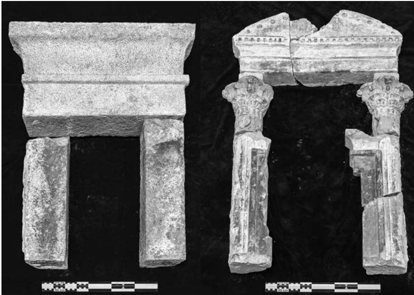
Fig. 4. Decorazione di due delle 15 cappelle in ST 6A

9287) e datato al 50 d.C. (anno XI dell'imperatore Claudio) 23 . All'interno quasi tutte le nicchie erano intonacate con stucco bianco; in esse erano forse collocate statuette ma anche probabilmente dipinti su tavola. Poche e frammentarie sono le sculture rinvenute, come la parte inferiore di una statuette raffigurante un probabile dio Ptah in calcare, e due teste di cocodrillo in legno stuccato e dorato. I pannelli lignei dipinti dovevano essere numerosi, data la notevole concentrazione in questa sala di parti di essi e di cornici. Erano composti da più tavole affiancate e assemblate in cornici di legno, a formare veri e propri quadri. Non è chiaro dove fossero collocati, ma l'assenza di impianti per la sospensione suggerisce potessero essere sul fondo delle nicchie, visibili solo in parte attraverso la decorazione architettonica anteposta. I motivi raffigurati sulle tavole rinvenute sono molto frammentari e talora di difficile lettura a causa della perdita di parti dello stucco dipinto. Alcuni frammenti, tuttavia,