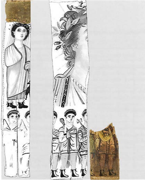
Fig. 6. Ricostruzione virtuale del pannello JE 31571b (@Vincent Rondot, Derniers visages des dieux d'Egypte , p. 107) con aggiunta di Dime 6291 a,b

7). Alquanto incomplete, esse ritraggono una divinità maschile talora in trono con un coccodrillo in grembo, circondata da una serie di personaggi armati, soldati o divinità in armi, oppure la parte destra di un busto di una divinità maschile radiata, con nimbo. In quest'ultima raffigurazione dalla chioma riccioluta del dio spunta la testa di un falco. Anche in questo caso il dio è circondato dalla stessa serie di personaggi armati, ed è affiancato da una figura femminile che tiene un cagnolino al laccio.