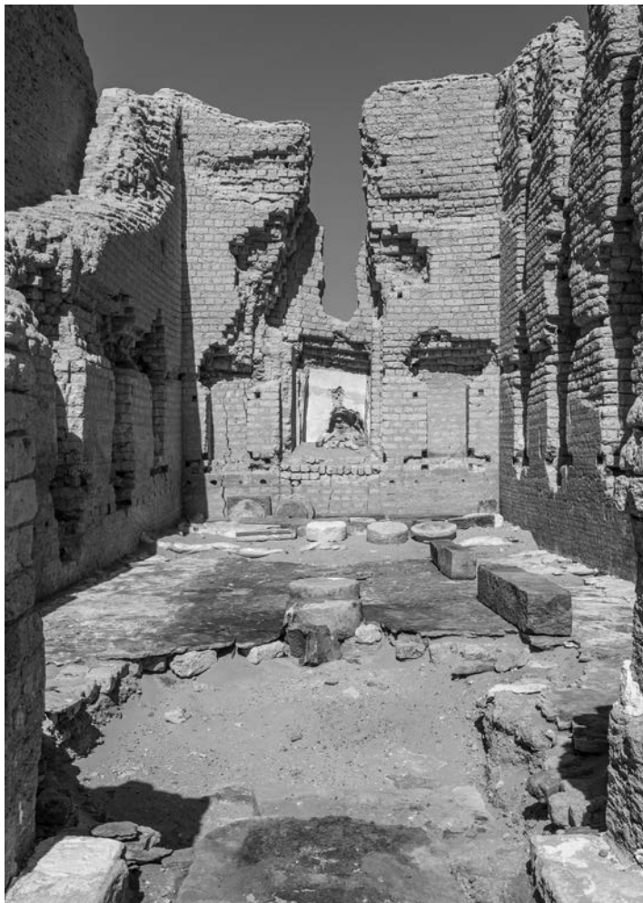
Fig. 3. La sala ST 6A

dal pavimento, anch'esso in parte conservato e costituito da sottili lastre di pietra locale. Si tratta di un edificio connesso con il culto, forse un deipneterion 19 ,