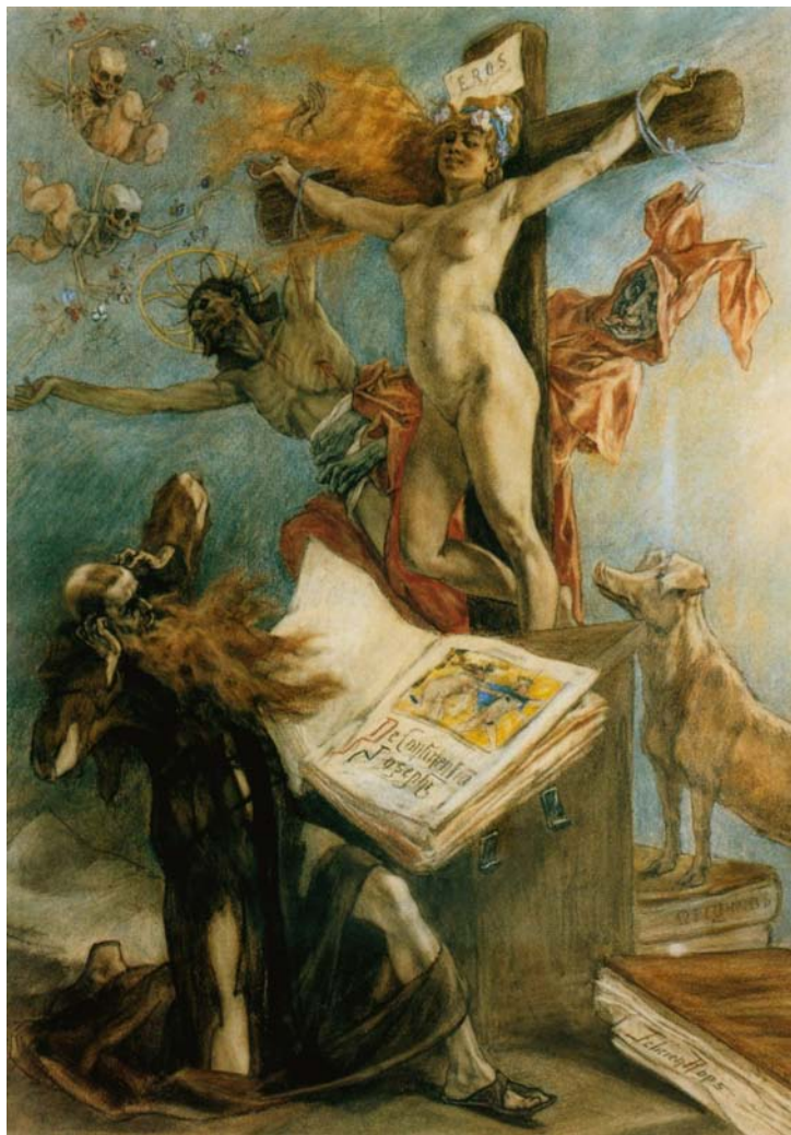
Félicien Rops (1833-1898) La tentation de saint Antoine

Il maiale è posto in posizione speculare rispetto al santo nel dipinto in cui è centrale l'immagine sacra/demoniaca.