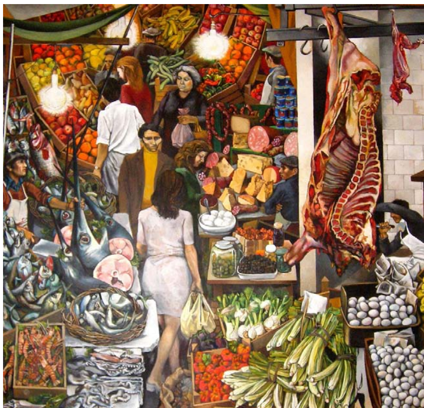
Renato Guttuso, La vucciria , 1974