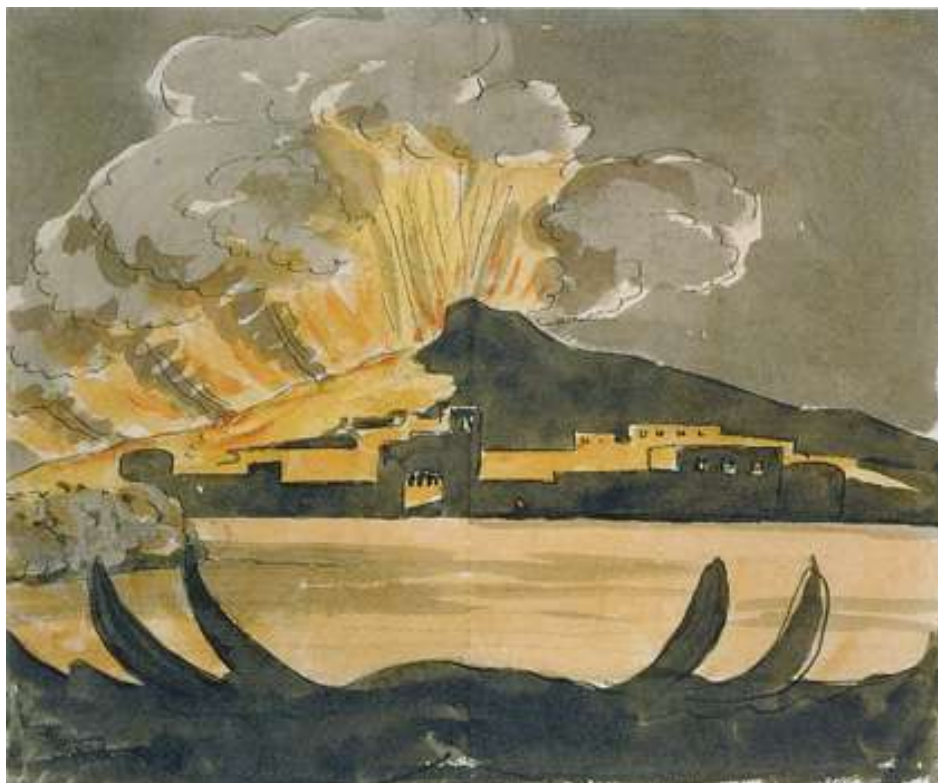
Figura 7 Johann Wolfgang Goethe, Eruzione del Vesuvio , 1787; pennino nero su tracce a matita, acquerello.