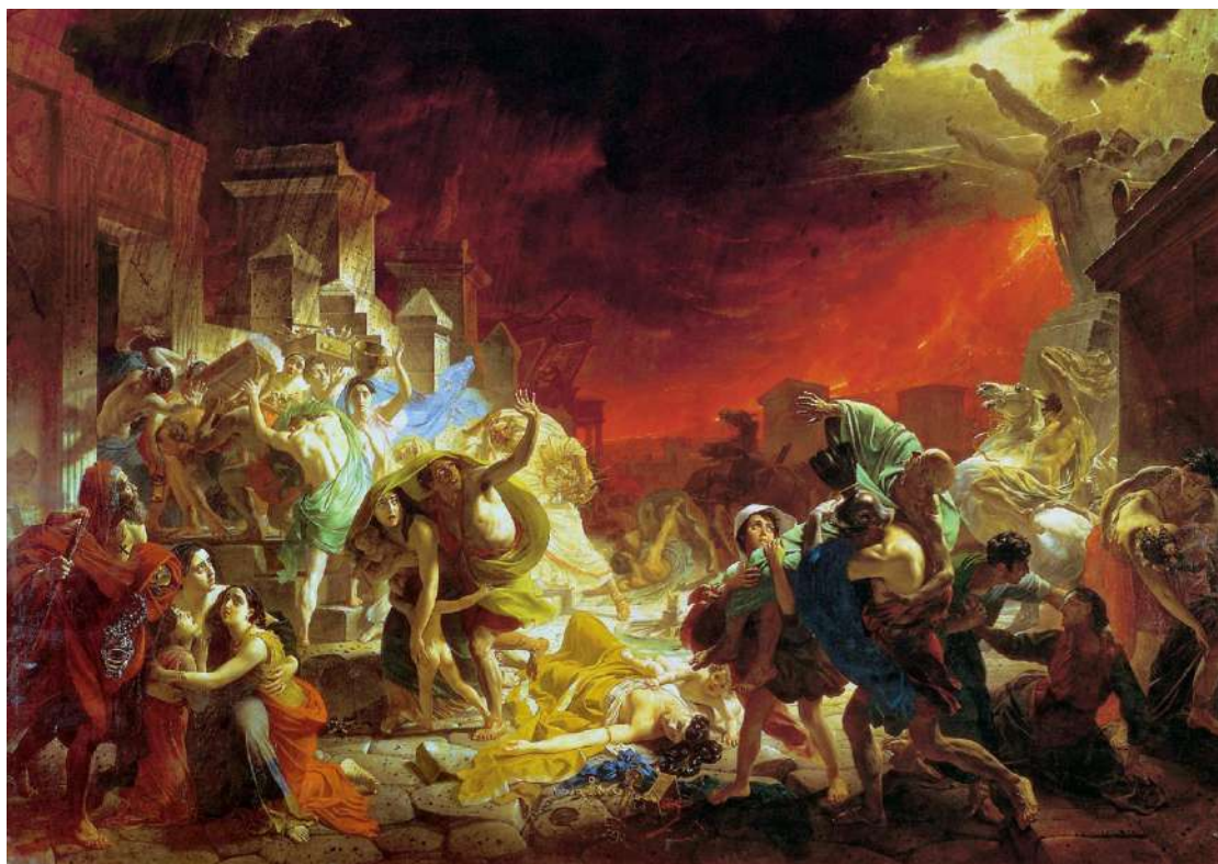
Figura 5 Karl Brjullov, L'ultimo giorno di Pompei , 1833; olio su tela