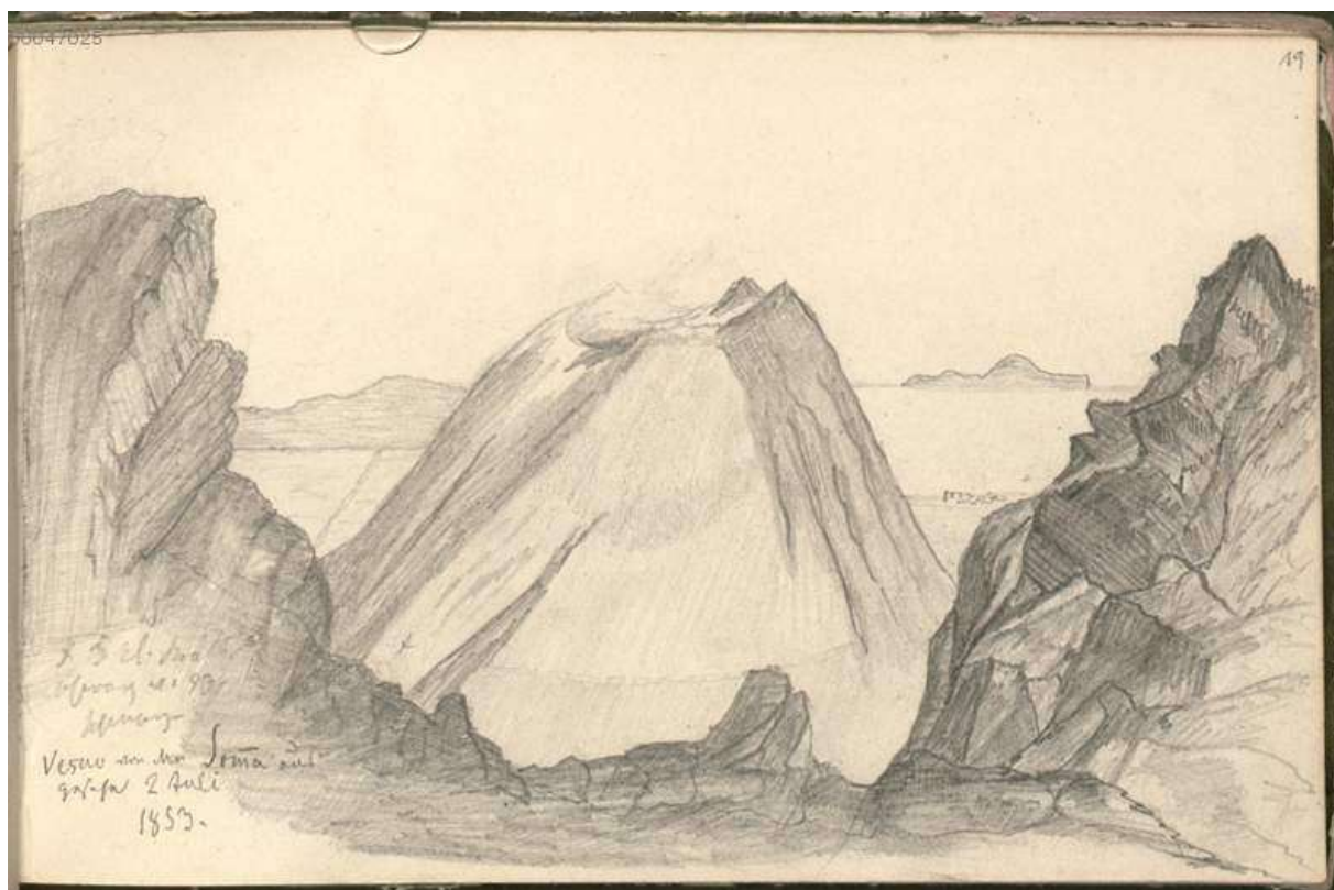
Figura 8 Ferdinand Gregorovius, Il Vesuvio visto dal monte Somma , 1853; matita su carta.