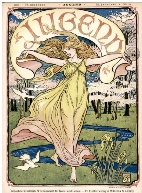
Illustrazione 3 Frontespizio della rivista “Jugend”, 1898, 51.

La copertina numero 38 del 1904 è decorata con la celebre rappresentazione di Isadora Duncan creata da Friedrich August von Kaulbach, autore di numerosi ritratti di personaggi dell’alta società nel gusto dell’epoca. Questa illustrazione, riprodotta poi in numerose altre pubblicazioni, ha canonizzato l’immagine di Isadora Duncan come giovane danzatrice dalle movenze leggiadre (cfr. Ill. 1 al presente saggio).