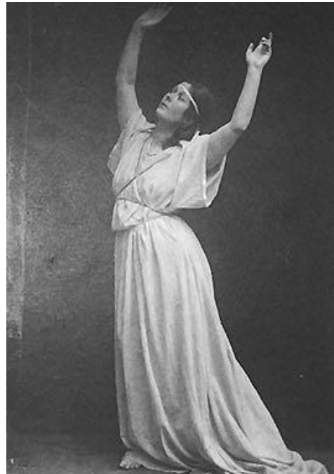
Illustrazioni 8 e 9 Isadora Duncan.