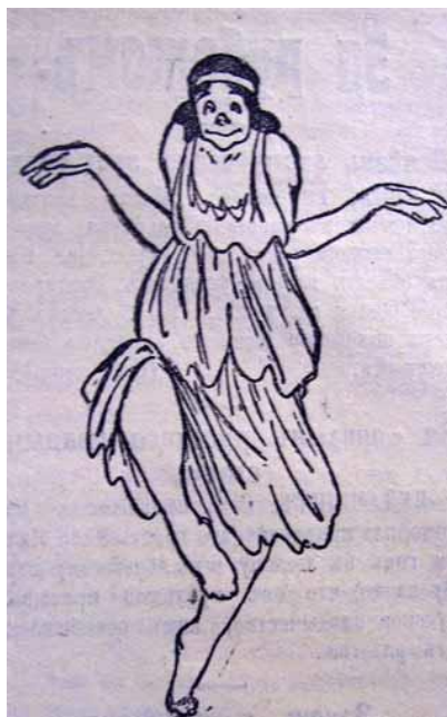
Illustrazione 13 Caricatura di Isadora Duncan.

La Duncan ha influenzato profondamente lo sviluppo non solo della danza e di tutto il teatro, ma ha rivoluzionato numerosi aspetti della vita, dalla moda, attraverso la valorizzazione della fisicità e della corporeità, alla autoconsapevolezza delle donne.