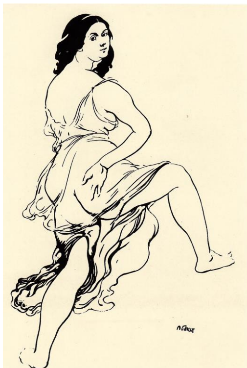
Illustrazione 12 Lev Bakst, Ajsedora Dulkan tancujuščaja (Isadora Duncan che danza) inchiostro di china su carta, “Birževye vedomosti”, 12 (25) dicembre 1907.