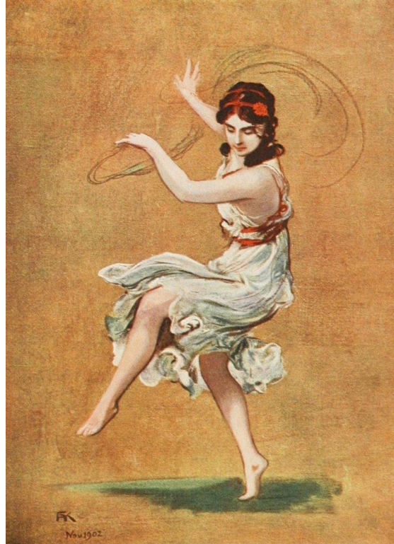
Illustrazione 1 Friedrich August von Kaulbach, Isadora Duncan , litografia a colori per il frontespizio della rivista “Jugend”, 1904, 38.