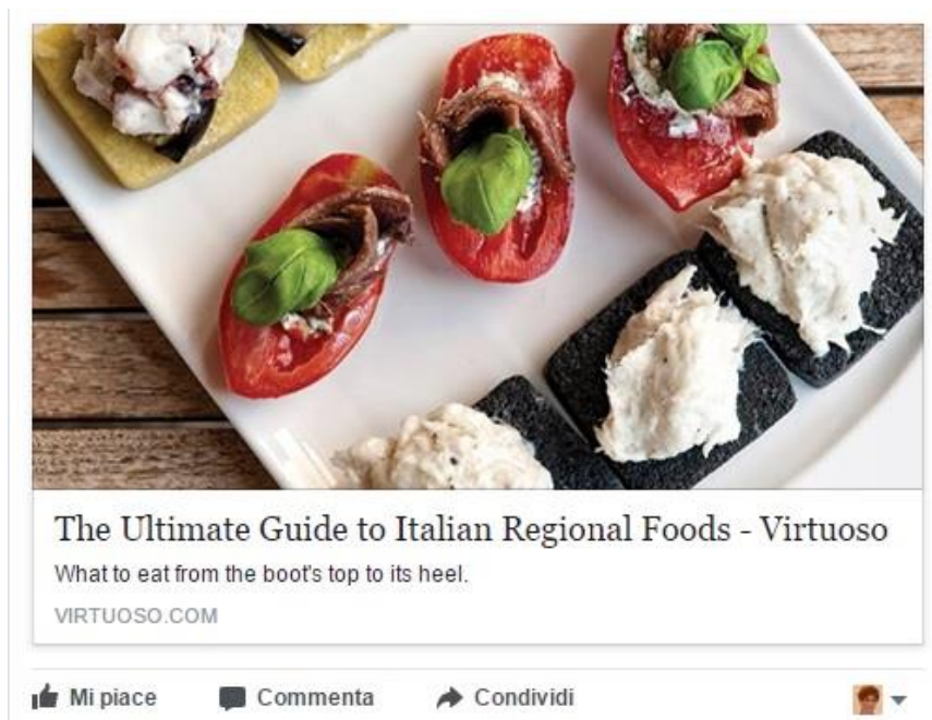
Foto 3 Esempio di immagine concettuale con processo analitico (da Virtuoso).

La foto 4 presenta invece un'immagine narrativa. Il vettore è rappresentato dalla linea creata dalla muta dei cani, che attraversa la foto in diagonale. Si distinguono inoltre chiaramente i dettagli dei partecipanti: il concorrente n. 4 e i suoi numerosi cani, ansimanti per lo sforzo.