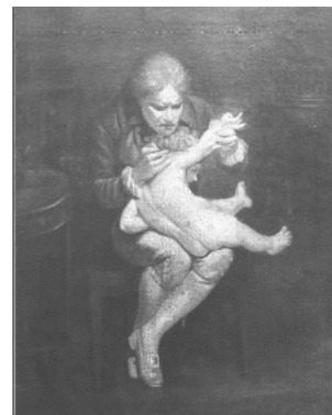
Figura 1: Edward Jenner vaccina un bimbo contro il vaiolo.

Nel Settecento si affermò nei paesi occidentali un approccio preventivo nei confronti delle malattie che portò alla scoperta delle vaccinazioni. Ma già secoli prima (1000 d.C.) in Oriente si diffuse una tecnica chiamata "variolizzazione", ossia l'inoculazione del virus del vaiolo in un