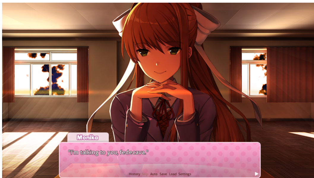
Fig. 5. Monika si rivolge direttamente al giocatore. Doki Doki Literature Club!

salute del proprio computer. 13 Lo sguardo inaggrabile di Monika, volto del malware che potrebbe stare divorando il computer del giocatore (ora addirittura chiamato per nome), raggiunge la vetta della propria creepyness :