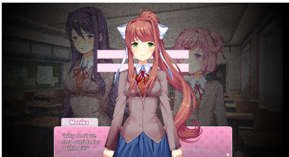
Fig. 3. L'invito di Monika (collocata al di qua del box coi dialoghi, a differenza degli altri personaggi). Doki Doki Literature Club! © Team Salvato.

Lo sguardo di Monika, a questo punto, è diventato a tutti gli effetti uno sguardo diretto e destinato non più al personaggio del giocatore, ma al giocatore stesso: infatti, è ormai evidente che Monika è un personaggio radicalmente de-diegettizzato (ammesso che mai fosse stato diegetico), in grado di prendere il controllo del gioco contrastando la volontà non solo degli altri personaggi, ma anche del giocatore stesso.