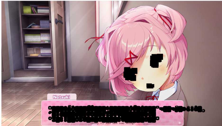
Fig. 1. Un glitch visivo che coinvolge Natsuki. Doki Doki Literature Club! © Team Salvato.